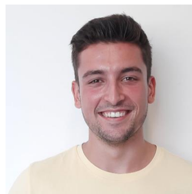
Meester Daan 2C